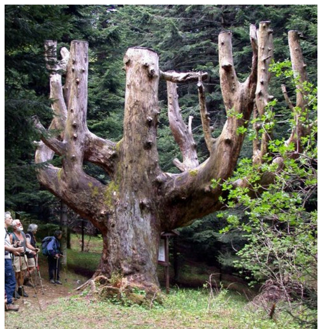
Gruppo UOEI davanti ai resti del grande abete bianco

7.30 - 8.00 - 8.30 - 9.00 - 9.30 - 9.45 - 10.00 - 10.15 - 10.30 - 10.45 - 11.00 - 11.15 - 11.30 - 11.45 - 12.00 - 12.15 - 12.30 - 12.45 - 13.00 - 13.15 - 13.30 - 13.45 - 14.00 - 14.15 - 14.30 - 14.45 - 15.00 - 15.15 - 15.30 - 15.45 - 16.00 - 16.15 - 16.30 - 16.45 - 17.00 - 17.15 - 17.30 - 17.45 - 18.00 - 18.15 - 18.30 - 18.45 - 19.00 - 19.15 - 19.30 - 19.45 - 20.00 - 20.30 - 21.00